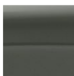
Verde Mineral (Metalizat)