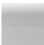
Alb Cristal (Metalizat)