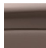
Arămiu Închis (Metalizat)