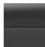
Gri Antracit (Metalizat)