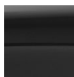
Negru Strălucitor (Metalizat)